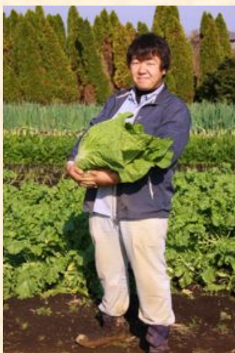
湘南の若手人気農家！ マスコミも注目する逸材